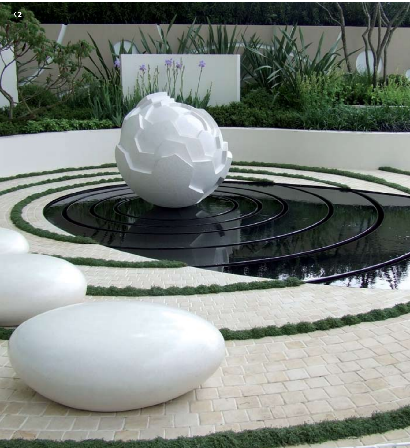
1. גן בהשראת מלונות בוטיק מהמזרח. עיצוב: David Cubero & James Wong